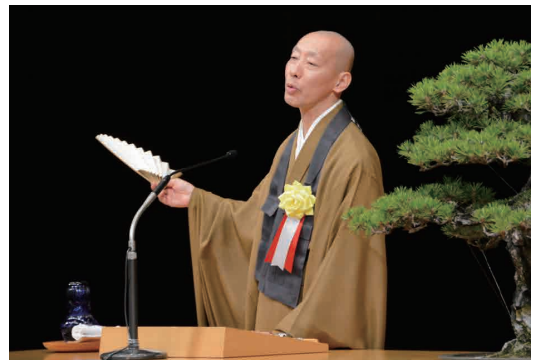
講師 恐山菩提寺院代 南 直哉氏 【プロフィール】

予告 平成28年度 青森県更生保護大会 開催日 11月8日(火) 開催地 青森市 リンクステーションホール青森