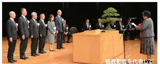
被表彰者を代表して