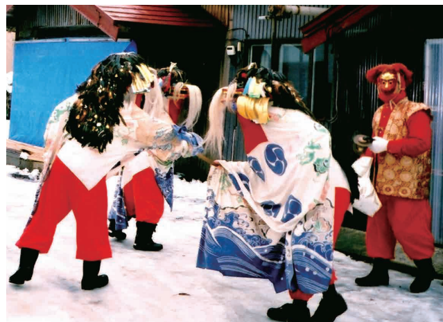
【新春に舞う】弘前市島井野 旧岩木町にて撮影。

発行日 平成28年3月31日 発行者 更生保護法人 青森県更生保護協会 青森県保護司会連合会 青森市長島1-3-25 電話 017(776)6419