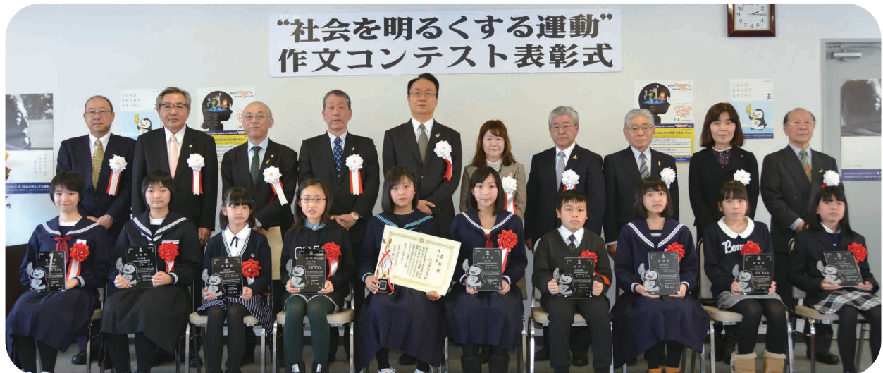
更生保護関係団体の代表と被表彰者