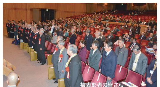
被表彰者の皆さん