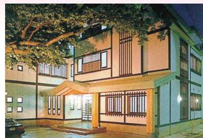
「柳の湯」ホームページより

北海道新幹線の開業、本州最北端青森県の中心都市である青森市 浅虫温泉津軽藩本陣の宿「柳の湯」に於いて、東北6県のBBS会員が 一堂に会し、会員相互の意識の統一と士気の高揚を図るとともに、 実践活動をより一層活発に展開するための研究協議を行い、BBS運 動の活性化を図ろうとするものです。